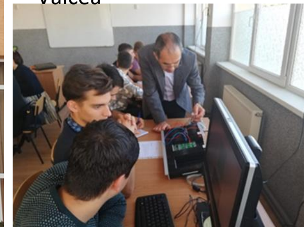
C.T. Gh. Asachi, București